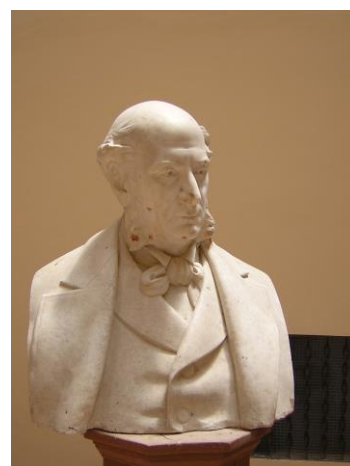
Sen. F.P. Perez

sbancamento e posizionamento del ciclopico zoccolo in pietra ad intaglio lasciato "rassodare" per un paio d'anni; 1883: innalzamento delle mura perimetrali in mattoni laterizi disposti "a tre teste" del primo piano fuori terra; 1884: innalzamento del secondo