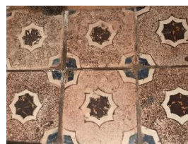
Particolari delle volte affrescate e dei pavimenti maiolicati