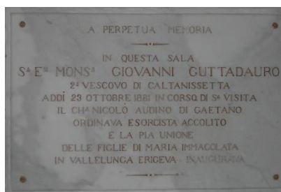
Un'iscrizione all'interno del salone