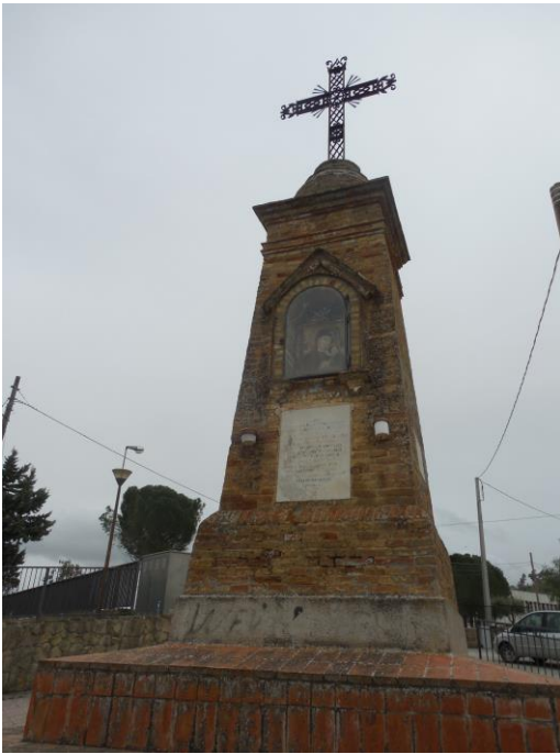
La "Santa Cruci"

Il monumento è stato realizzato in mattoni locali e dalla forma a tronco di piramide con terminale a cupola emisferica. Si deve dalla popolazione di Vallelunga su richiesta di un comitato spontaneo presieduto dal notaio Fortunato Bonasera su terreno comunale messo a disposizione del sindaco dell'epoca avvocato Rosario Audino per lasciare perenne memoria di una missione religiosa avvenuta in paese dal 12 marzo al 2 aprile 1905.