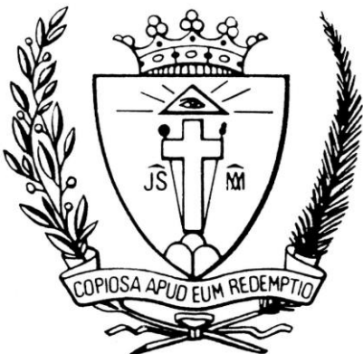
Stemma dei Redentoristi

Lo stemma della congregazione reca una croce con lancia da un lato e canna e spugna conficcata dall'altro, poste su tre monti; la croce è affiancata dai monogrammi di Gesù (JS) e Maria (MA) e sormontata da un occhio emanante raggi. Il motto è " copiosa apud eum redemptio " ("grande presso di Lui la redenzione"). La loro devozione tipica è nei confronti della Madonna del Perpetuo Soccorso , un'icona di scuola cretese ubicata nella chiesa di Sant'Alfonso a Roma (festa liturgica il 27 giugno): si tratta della "Madonna della Passione", o "Madonna Odigitria" (... che indica il cammino ). Mentre con il suo sguardo si rivolge a noi tutti, con la sua