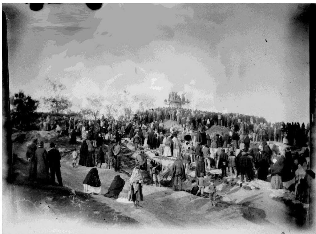
Vallelunga, marzo 1905 - Erezione della Croce a ricordo della missione dei Redentoristi