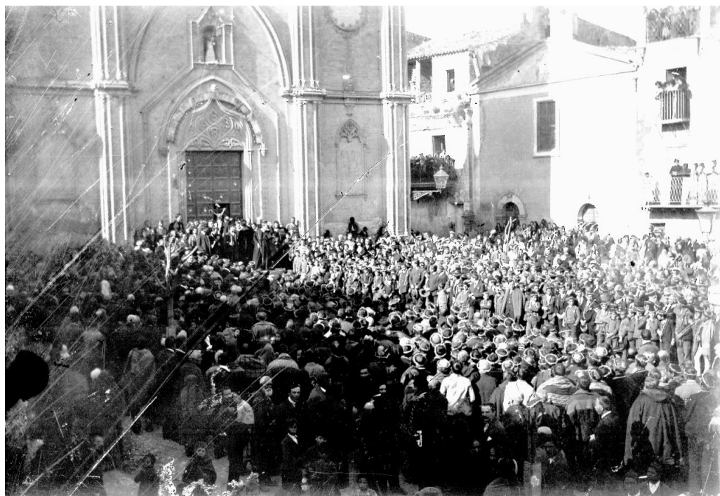
Vallelunga - Piazza Umberto I -marzo 1905 - via Crucis dei padri Redentoristi

per perdere pure un calzare! Lungo il basamento, all'interno della nicchia, ve ne è un esempio.